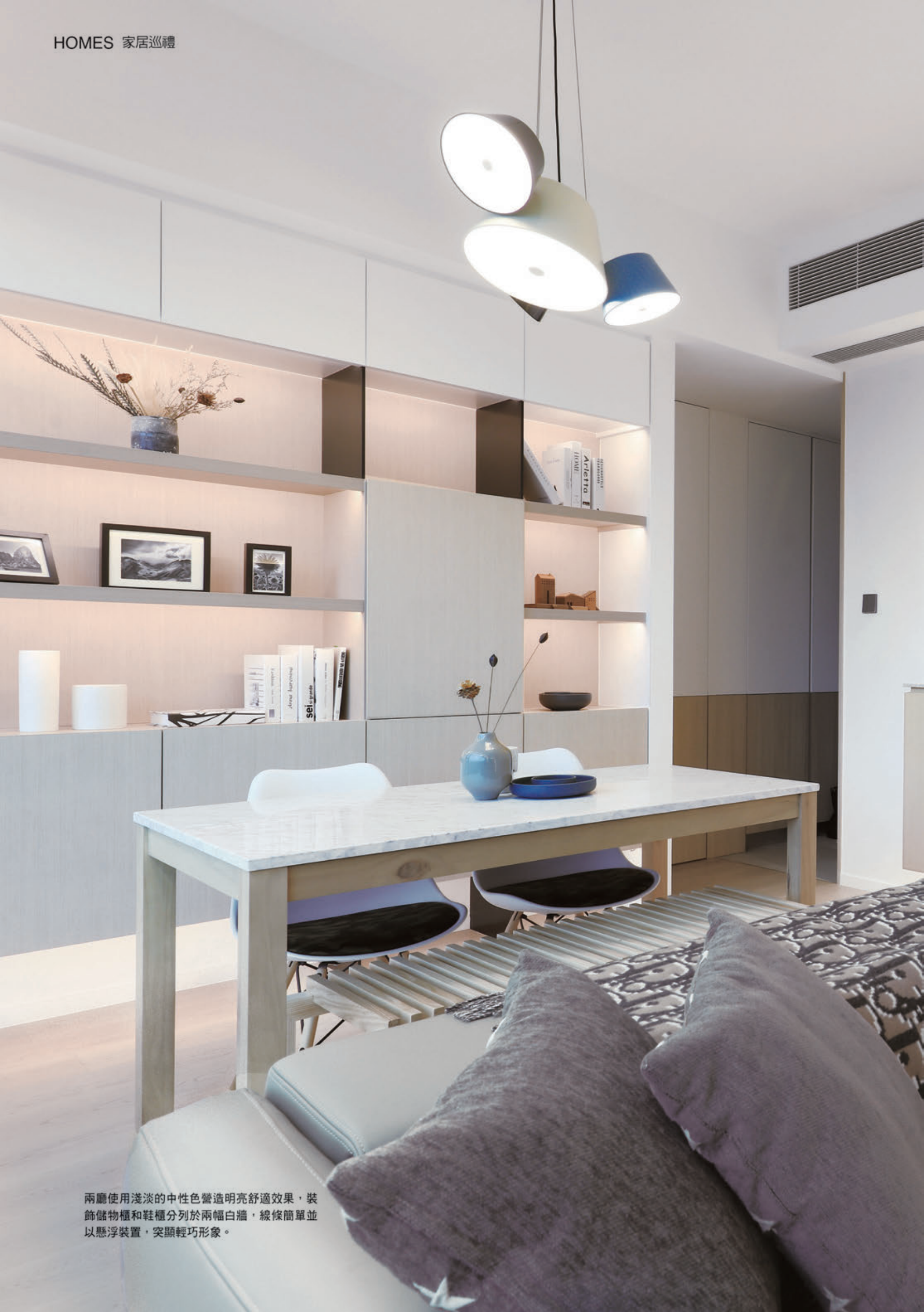
兩廳使用淺淡的中性色營造明亮舒適效果，裝飾儲物櫃和鞋櫃分列於兩幅白牆，線條簡單並以懸浮裝置，突顯輕巧形象。