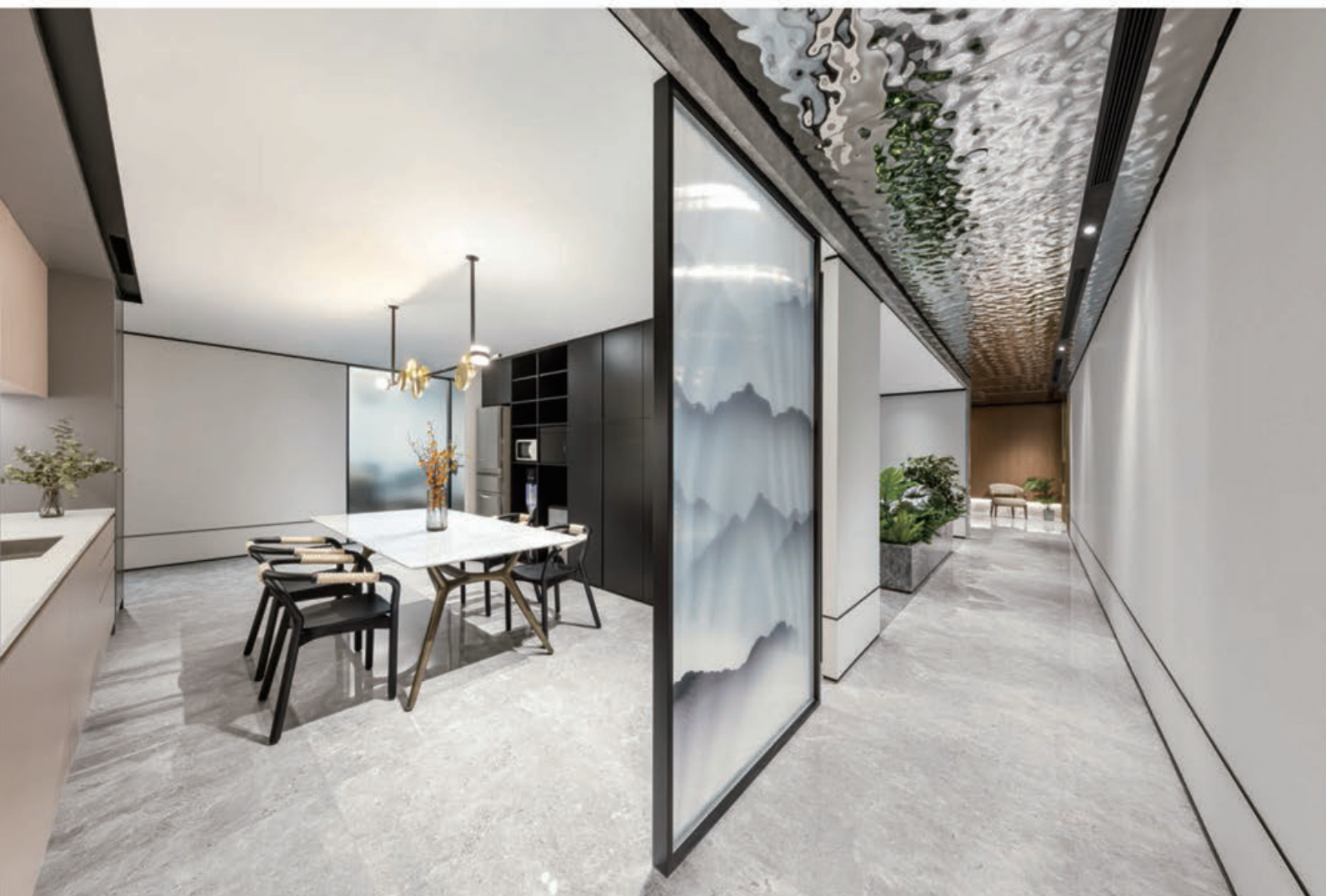
有見公司老闆為國內人士，設計師為茶水間注入中式氛圍，採用較深的木料，又以一幅特色中式山水玻璃作間隔。空間流露濃濃中式感覺，卻不偏離華麗主題，配以雲石餐桌和金色天花燈，頗富中西合璧的感覺。