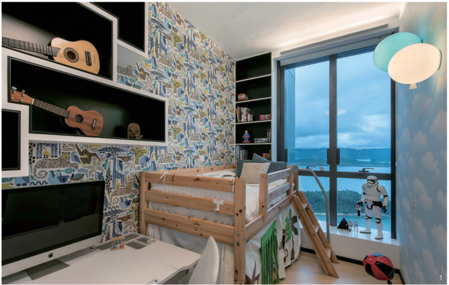
1.一對小兄弟共住的兒童房，兩邊壁面分別裱上動物和藍天白雲圖案牆紙，配上兩盞氣球燈，洋溢童真玩味。 2/3.多用途房內，備書櫃和書架等基本配置，另設日間床及投影幕，滿足工作間、客房、孩子玩樂室等多功能。